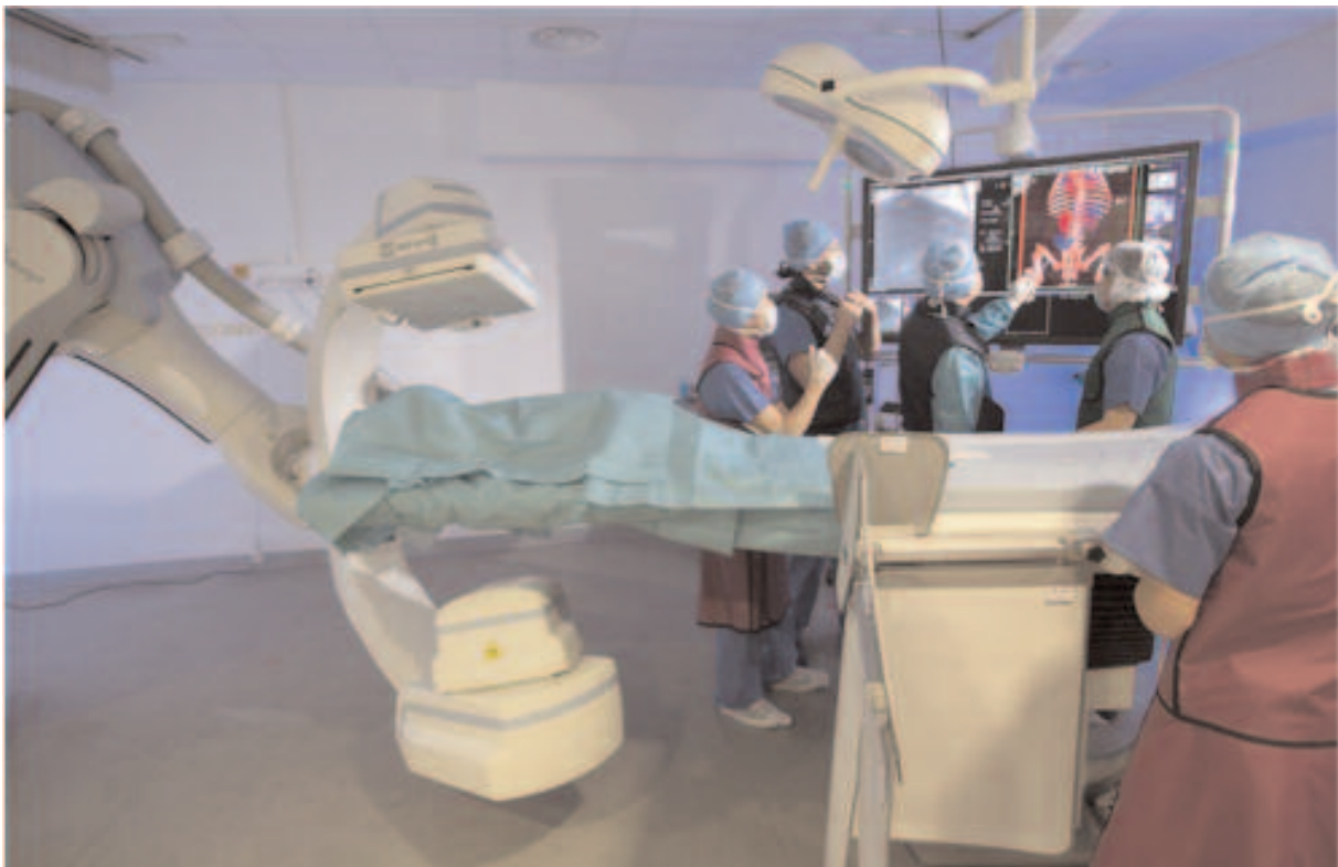
Chirurgie non invasive (Strasbourg)

Les ressources nécessaires, publiques et bancaires, ont été sécurisées pour un investissement annuel de 4,5Md€ spécifiquement dédié à la modernisation des hôpitaux sur nos territoires.