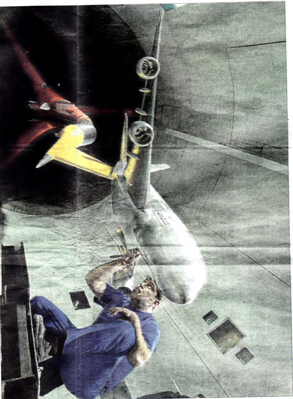
La soufflerie de Modane/Avrieux a permis de tester les performances de l'industrie aéronautique française. Son avenir sera moins glorieux, si des travaux urgents ne sont pas effectués pour empêcher le bâtiment de s'effondrer.

La situation de ce site majeur pour l'Office national d'études et de recherches aérospatiales (Onera) est bien connue du ministère de la Défense, interpellé à plusieurs reprises sur l'état inquiétant de l'équipement. « Le ministère de la Défense ne laissera pas tomber l'Onera », a assuré Jean-Yves Le Drian, le 27 octobre, à la députée Isabelle Brienneau, membre de la commission nationale de défense, qui l'interpellait sur l'avenir incertain de l'équipement savoyard. Dans un rapport accessible (lire ci-dessous), elle estime qu'il faudrait débloquer 20 millions pour réaliser les travaux indispensables.